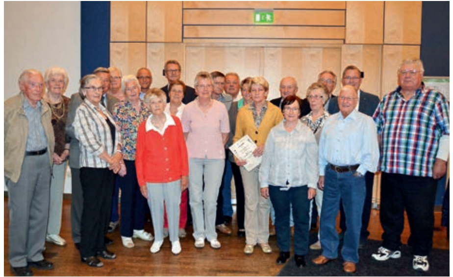
Ehrung der Jubilare

Wirksam wird der Beschluss ab dem 01.01.2016.