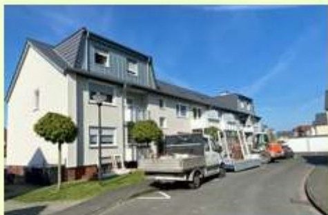
Anbau von 12 Balkonen am Schwalbenweg 1-11