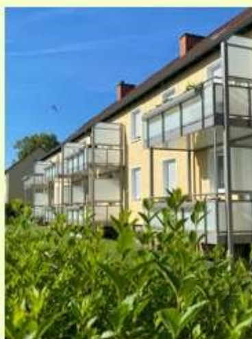
Anbau von 16 Balkonen am Halohweg 2-8