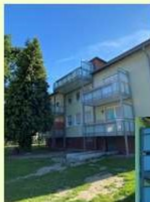
Anbau von 13 Balkonen am Ostkamp 7-9 und Ostkamp 11